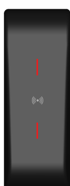
LED Rouge Accès refusé