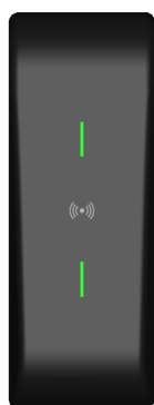
LED Verte Accès autorisé